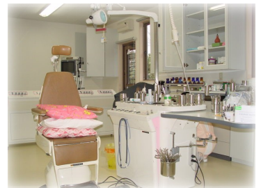
診療室 (耳鼻いんこう科)